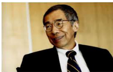
رئیس آرشیو ملی سنگاپور (در سال ۲۰۱۳)